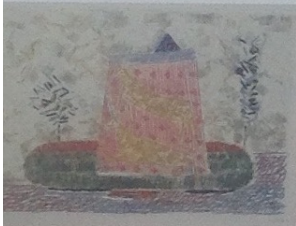
Louttre B., La Dame à la licorne.